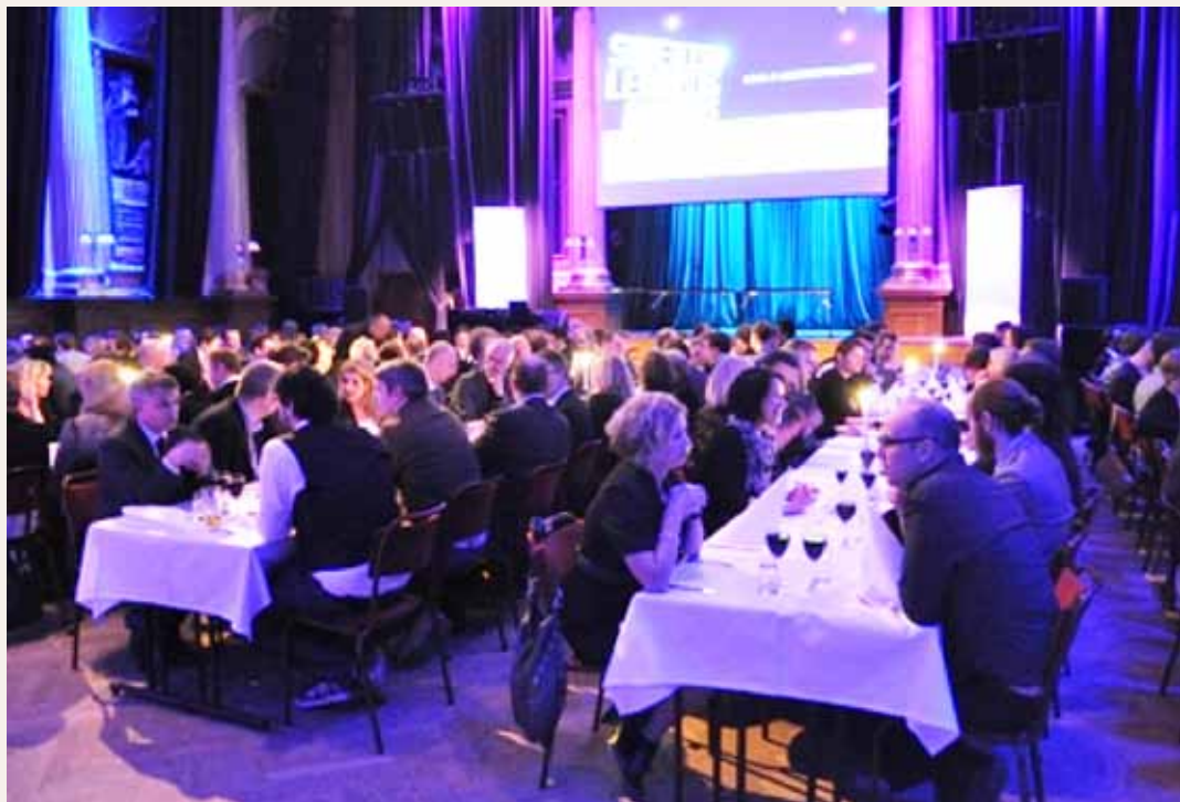
Prisutdelningen, Swedish Learning Awards.

Kompetensmatris är utvecklad för analys och kartläggning av kunskapsbehov. Först får individen betygsätta sin egen kunskap inom ett specifikt område. Där efter får hon svara på ett antal frågor som mäter hennes faktiska kunskap. Resultatet redovisas sedan i ett spindeldiagram som belyser harmonier och skillnader. Inför en utbildning kan Kompetensmatrisen avgöra vilka delar av utbildningen som en person behöver tillgodogöra sig. Efter en utbildning kan ett test bekräfta att personen har tagit till sig kunskaperna.